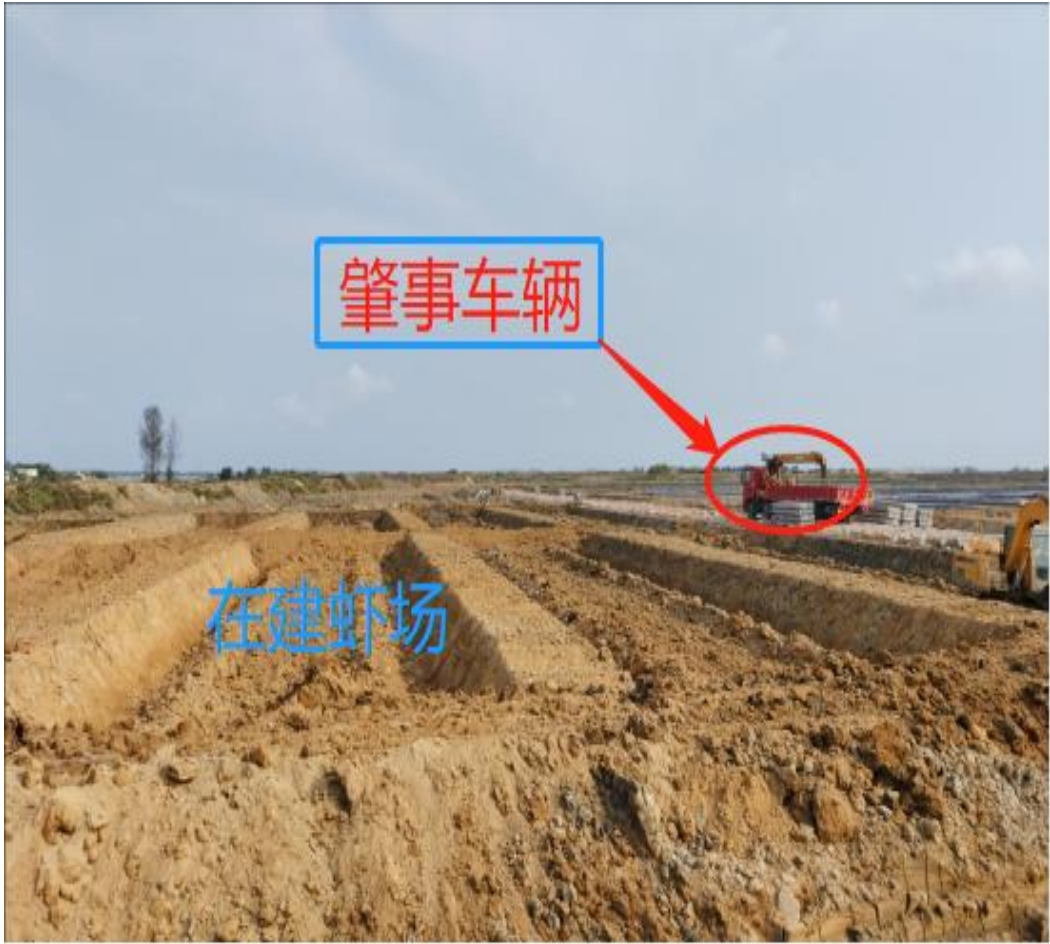
图 1 在建的水洋村养虾场