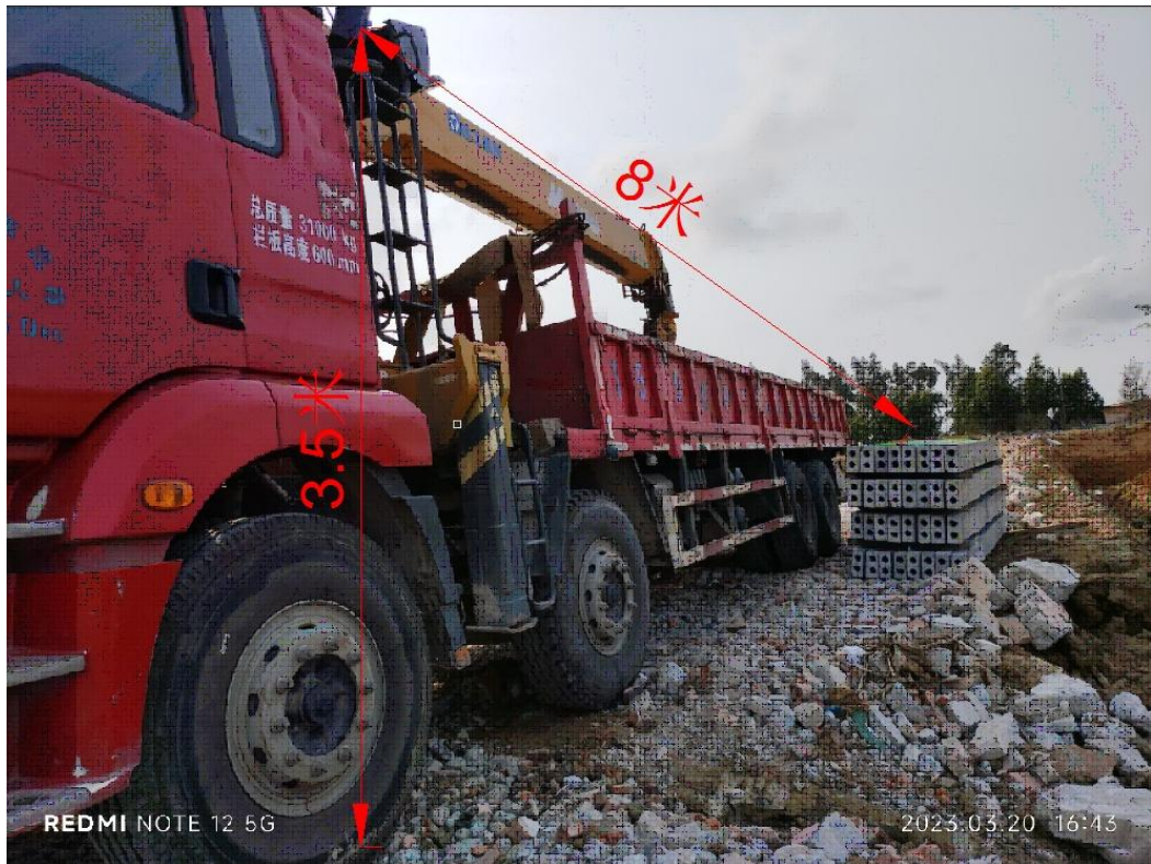
图 6 起重机操作台状况

5. 随车起重机操作台离地高度为 3.5 米，距事发点直线距离为 8 米，如图 6 所示。