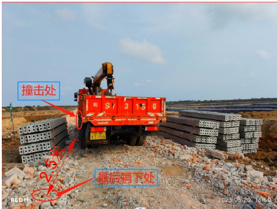
图 4 周某海最后躺下处