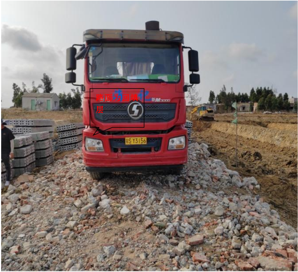
图 2 肇事车辆作业时停放的路面状况