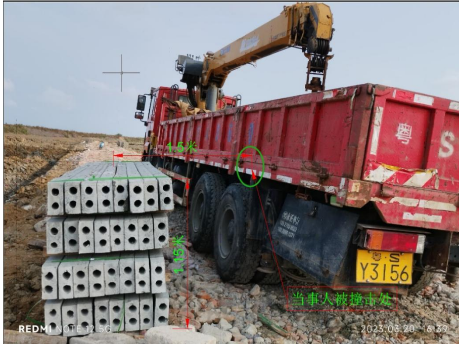
图 3 周某海受撞击时站立的位置

3. 根据现场作业人员对事故发生情况的描述，结合现场勘查情况及分析，得出事发现场周某海受到预制板撞击时的大致情况，如图 3、4 所示。