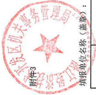
项目支出绩效自评基础数据表