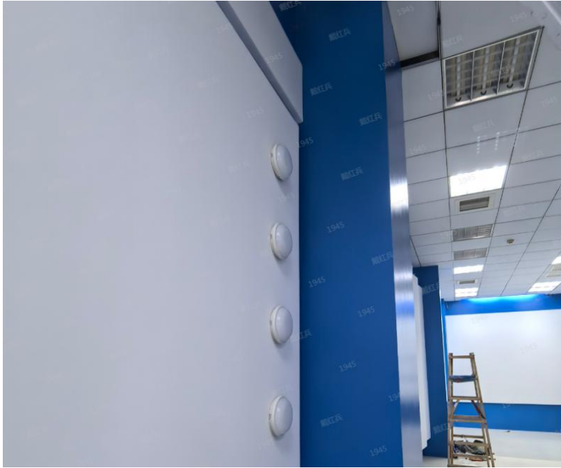
图 8：4 盏 LED 灯